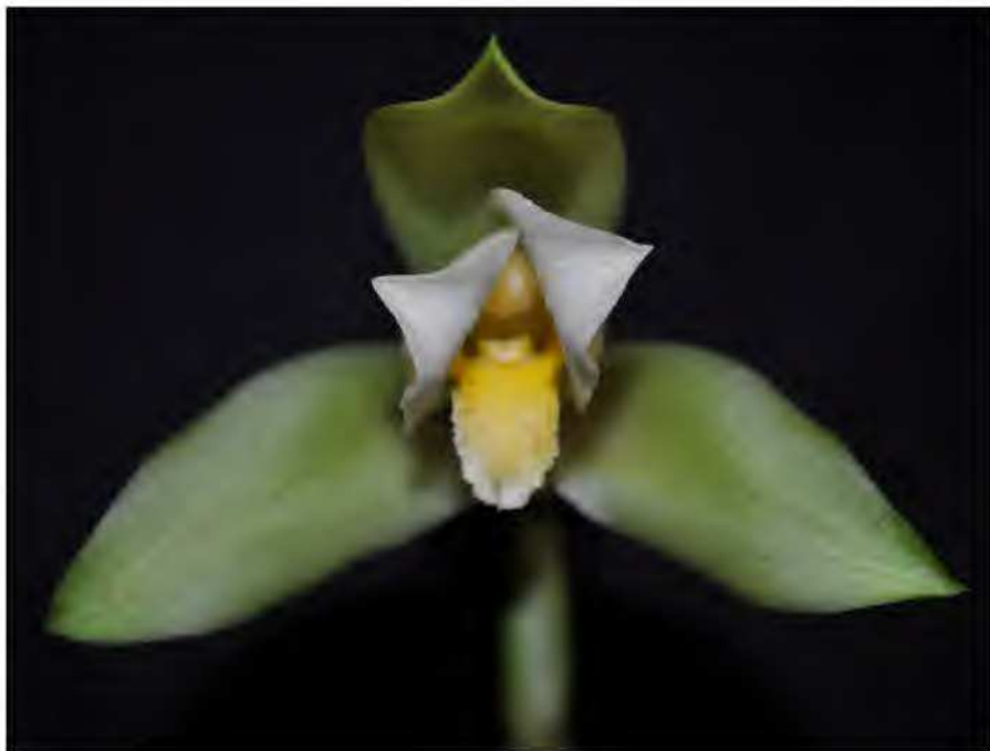
Fig. 1 : Lycaste annakamilae